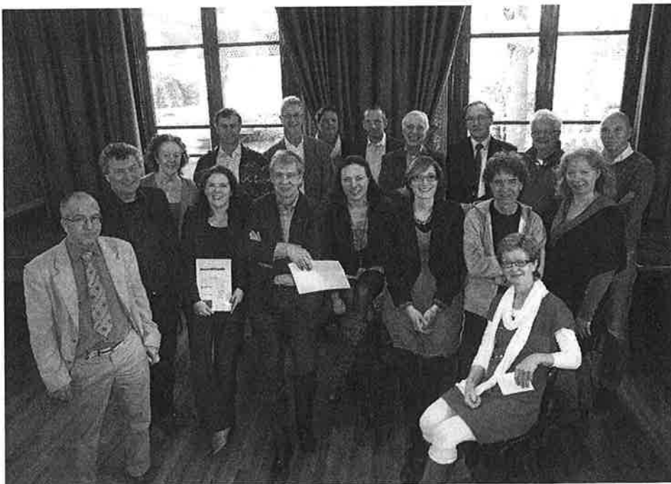
Ondertekening van Visie op Broek

B roek in Waterland. Een dorp met een rijke historie, een levendig heden. Een dorp waar wij graag wonen. Een dorp waar wij ook in de toekomst graag willen blijven wonen, werken en recreëren. Met behoud van het karakter, met respect voor de historie en met een open oog voor de toekomst.